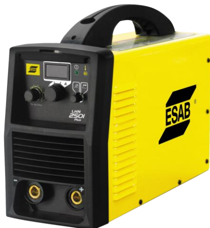
LHN 250i Plus

Конструкция аппарата LHN 250i Plus имеет высокую прочность, мощность, надежность и другие характеристики, которые облегчат вашу повседневную работу - например, цифровую панель индикации, длинные сварочные кабели и несколько ручек для переноса аппарата.